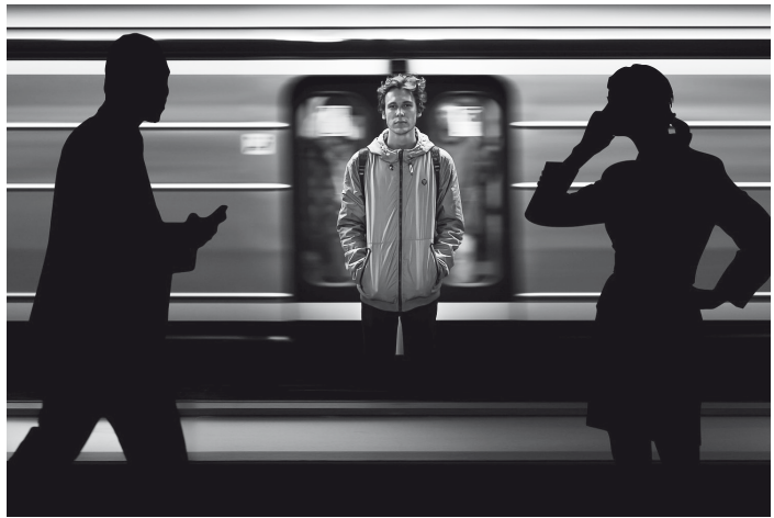
Abb. 1: Mangels Zugang zu Smartphone und Co. erleben Menschen mit Behinderung in stationären Einrichtungen häufiger Ausgrenzung

In der MeKoBe -Studie lag der Schwerpunkt vor allem auf sozialen Faktoren, den sogenannten Gelegenheitsbarrieren nach dem Partizipationsmodell von Beukelman und Mirenda (1998), die sich nicht auf individuelle, sondern auf soziokulturelle Barrieren beziehen. Dabei spielten vor allem Fragen zur Haltung der Mitarbeitenden der Behindertenhilfe gegenüber Medien generell sowie zur Mediennutzung der Klientinnen und Klienten eine große Rolle. Das Partizipationsmodell zielt auf die Planung und Implementierung von Interventionen und mündet in Schulung und Training (vgl. Thiele 2016). Daher erschien es als theoretische Rahmung für die Studie besonders geeignet. „Das Partizipationsmodell verdeutlicht in diesem Zusammenhang, dass in dem Prozess der Implementierung nicht nur die oder der Betroffene selbst, sondern auch dessen Umfeld einbezogen und geschult werden muss, um die jeweilige Interventionsstrategie langfristig und nachhaltig zu implementieren.“ (Bosse et al. 2018, S. 5) Dieses Modell steht im Zusammenhang mit dem der Studie zugrundeliegenden Verständnis von Behinderung, auf welches sich die Weltgesundheitsorganisation international verständigt hat. In der Klassifikation der Funk-